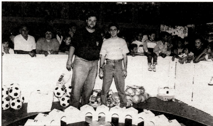
Até os adultos torciam no jogo da toca do coelhinho

O Arraiá da SPAL também contou com a animação de show circense de palhaços e mágicos e com muita música sertaneja, que alegraram ainda mais a comemoração. Esse é mais um evento que já faz parte da cultura da empresa. Parabéns aos organizadores e aos colegas que participaram com muita satisfação. Até a próxima festa, pessoal!