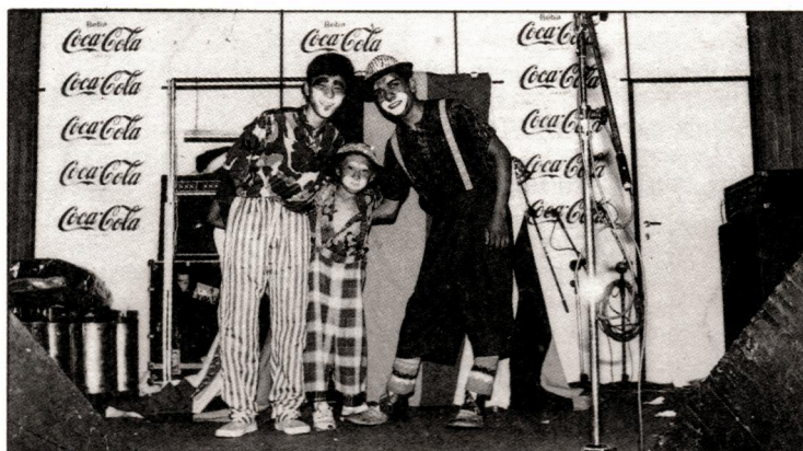
A criançada se divertiu muito com a dupla de palhaços

E foi exatamente com esse espírito descontraído que a empresa reuniu seus funcionários, num clima de muita alegria e amizade, na festa junina Arraiá da SPAL , realizada no dia 28 de junho (domingo) no Grêmio Rolamentos Scharfflers